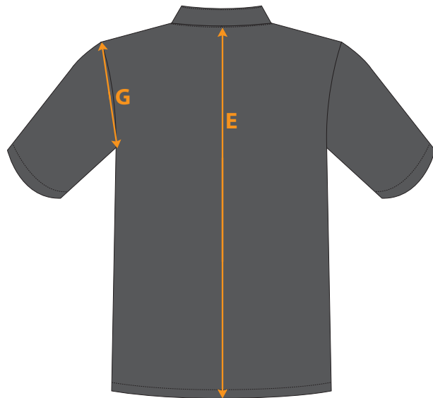
TABLEAU DE MESURES TUNIQUE HOMME MC - MONTAUBAN